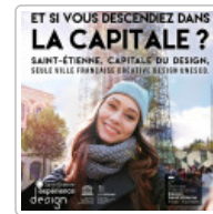
Capitale du design Saint-Étienne