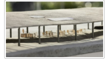
Freeing Architecture Événement