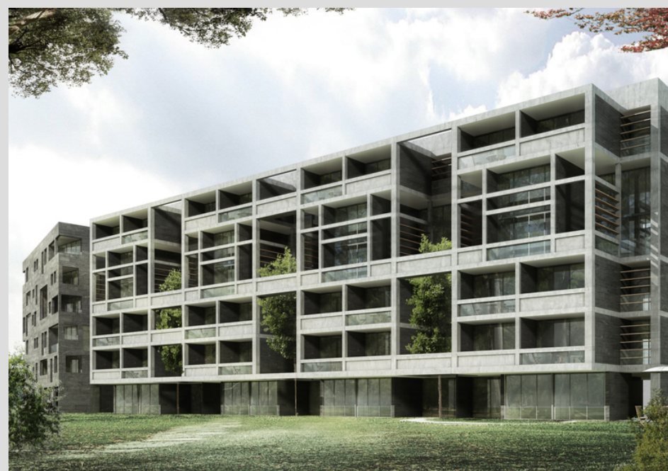
Projet résidentiel, conçu par Roula Salamoun. © Roula Salamoun.

L'architecture consiste à développer des solutions spécifiques à un site particulier, dans un contexte précis, en prenant en compte les exigences du client. Bien que les projets que j'ai conçus soient pour la plupart contemporains, j'aimerais travailler à la rénovation d'une maison libanaise traditionnelle. Ce serait une excellente occasion de diffuser les qualités de tels espaces et de cette typologie.