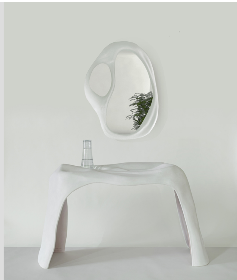
Anatomy par Roula Salamoun. © Roula Salamoun pour House of Today.